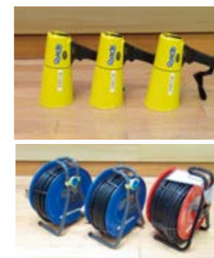
拡声器メガホン型 3台 コードリール 3台