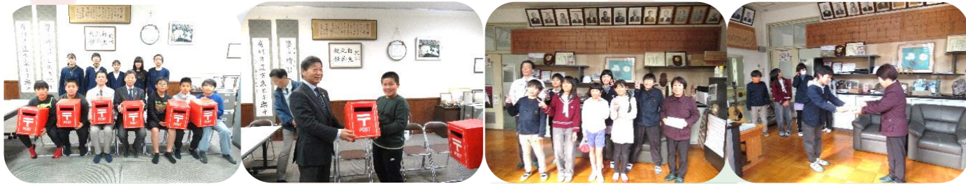
▲多賀小学校のみなさん